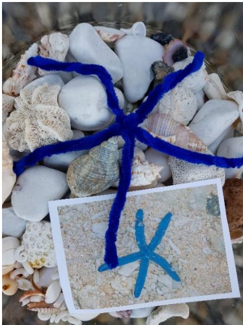
Bild: Gebastelter Seestern auf Muscheln mit Foto aus Vanuatu

Am 28.02.2021 ist ab 10.00 Uhr ein WGT-Gottesdienst mit Kindern auf dem Kindergottesdienst-Kanal abrufbar: www.kirchemitkindern-digital.de . Mit dabei ist Pfarrerin Susanne Fuest, mit der wir im Januar im Rahmen einer Online-Veranstaltung schon einige kreative Ideen ausprobiert und eine kleine Reise nach Vanuatu unternommen haben.