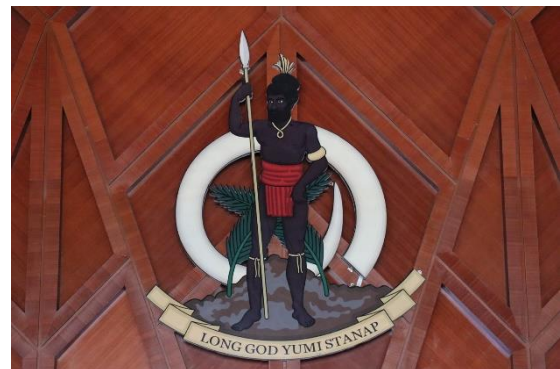
Bild: Wappen von Vanuatu mit der Aufschrift „Long God yumi stanap – In God we stand“

In vielen Gemeinden in Bayern und Regionen der Welt wird zurzeit intensiv daran gearbeitet, wie der Weltgebetstag auch in diesem Jahr begangen und die Kollekte gesichert werden kann. Herzlichen Dank für Ihr und Euer großes Engagement und die beeindruckende Kreativität! Das „In God we stand“ aus Vanuatu kann uns durch diese schwierigen Zeiten tragen. Am ersten Freitag im März können wir uns alle – wenn auch anders als sonst – einreihen in die wunderbare Gebetsgemeinschaft rund um den Globus und uns so miteinander verbunden wissen.