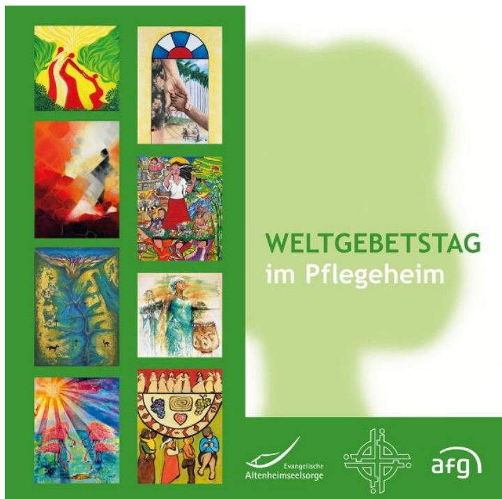
Bild: Broschüre zur Feier des Weltgebetstags in Pflegeheimen, auch in gedruckter Form im Amt für Gemeindedienst bestellbar